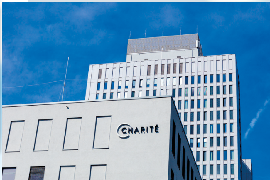
Charité's hovedsæde midt i Berlin.

Charité er ejet af Berlin og har en omsætning på 2 mia. euro om året. Tidligere i år blev hospitalet i en undersøgelse, som magasinet Newsweek gennemførte, kåret som det bedste hospital i Europa og det femte bedste i verden. I en anden undersøgelse, som Focus-magazine stod bag, blev Charité for niende år i træk kåret til Tysklands bedste hospital. Danskere kender muligvis hospitalet fra den kendte Netflix-TV-serie af samme navn.