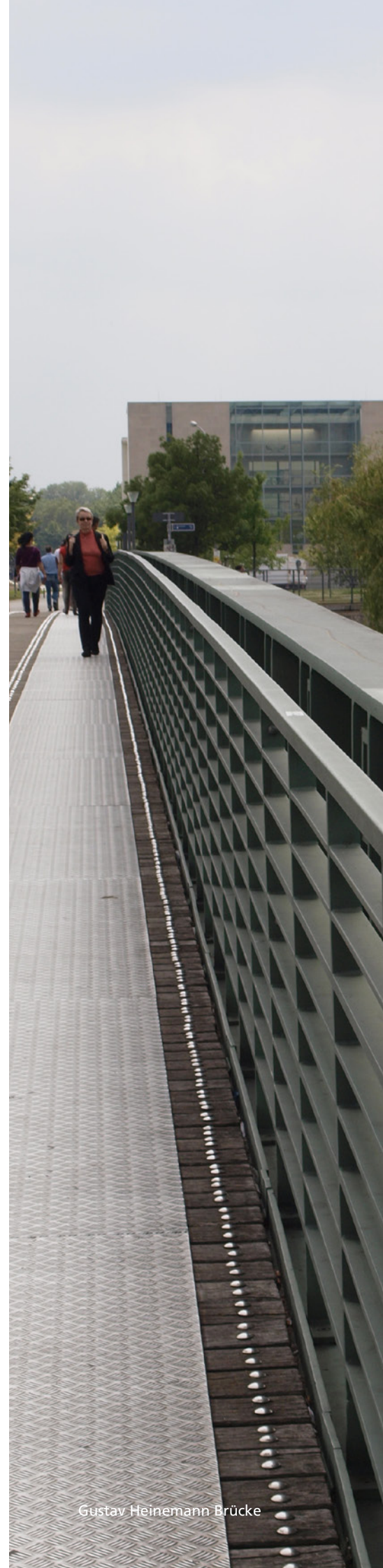
Gustav Heinemann Brücke