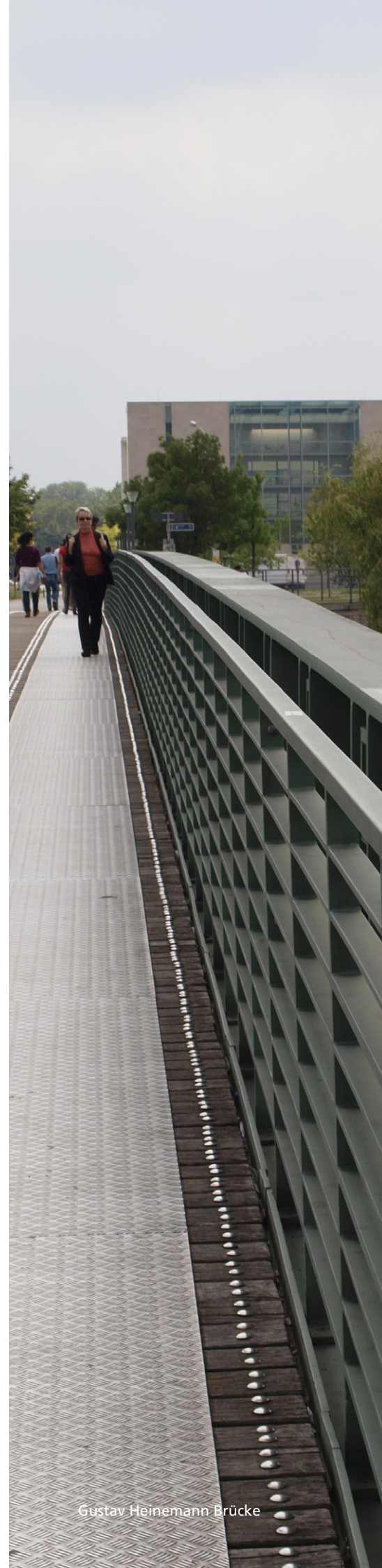
Gustav Heinemann Brücke